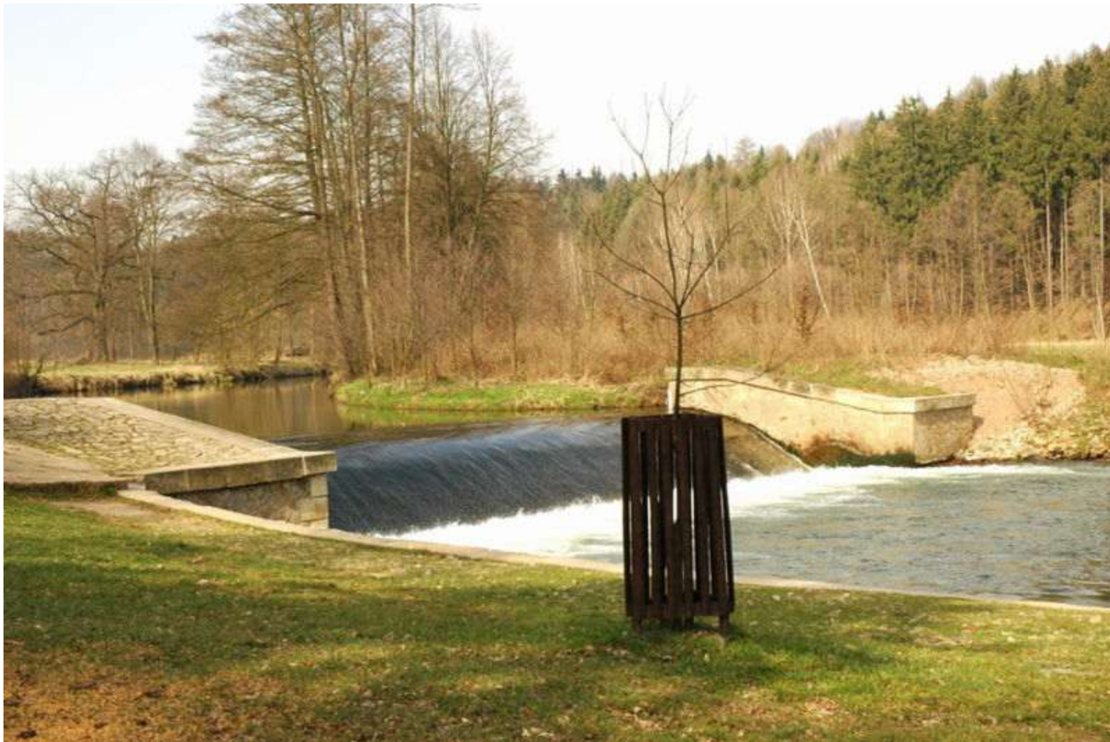
Obr. 6 Viktorčin splav