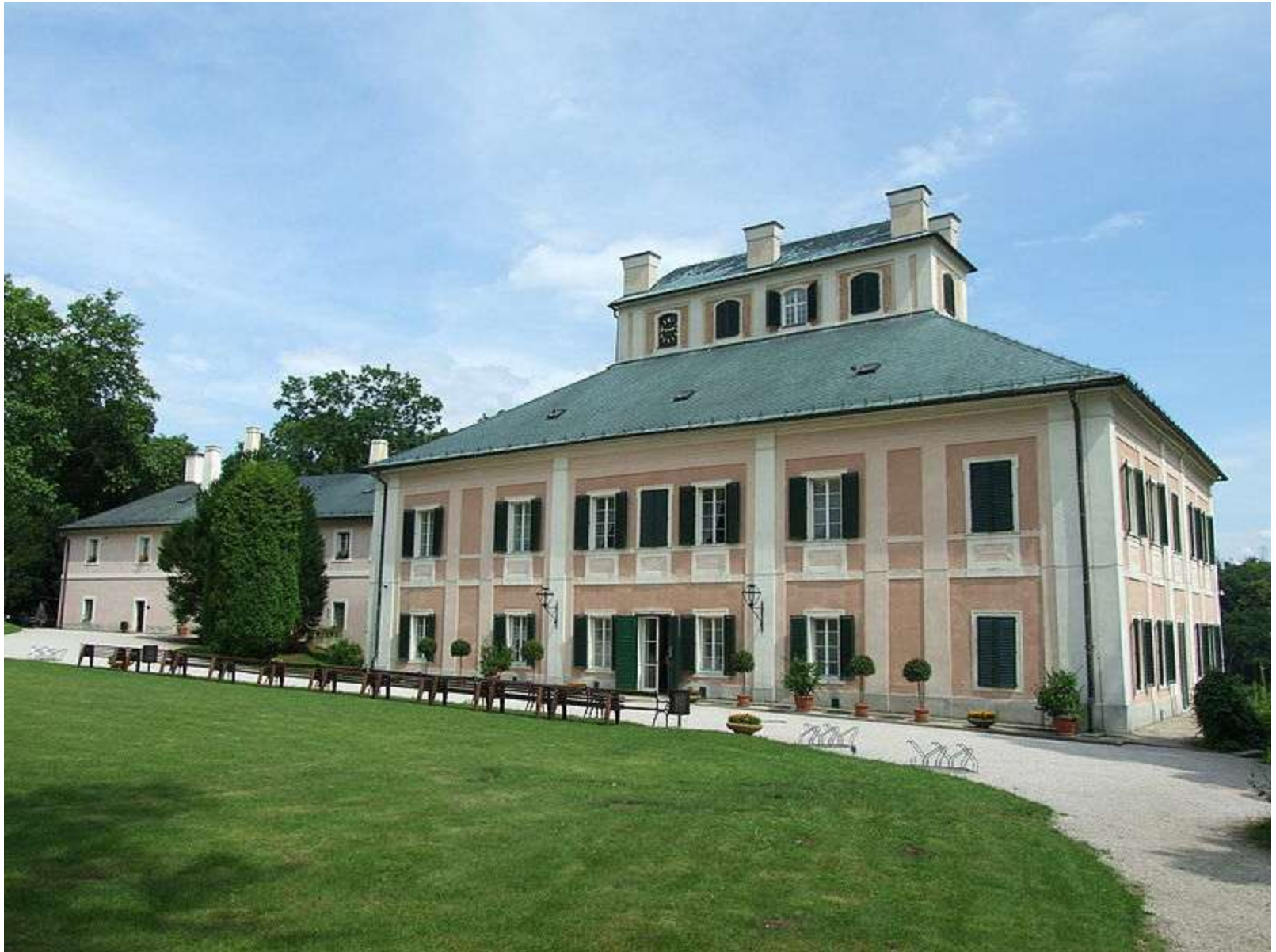
Obr. 5 Ratibořický zámek