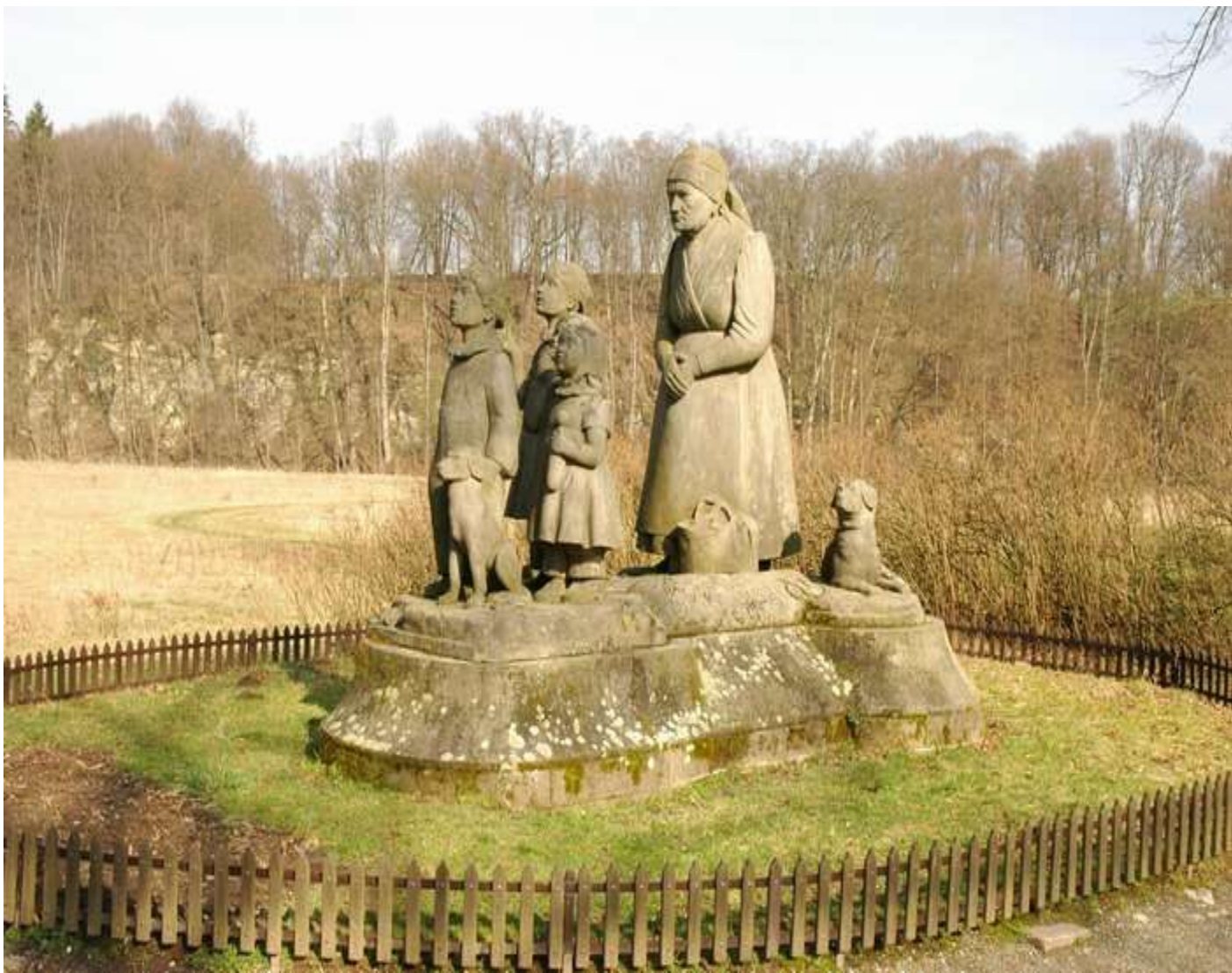
Obr. 2 sousoší Babičky od Otty Gutfreunda