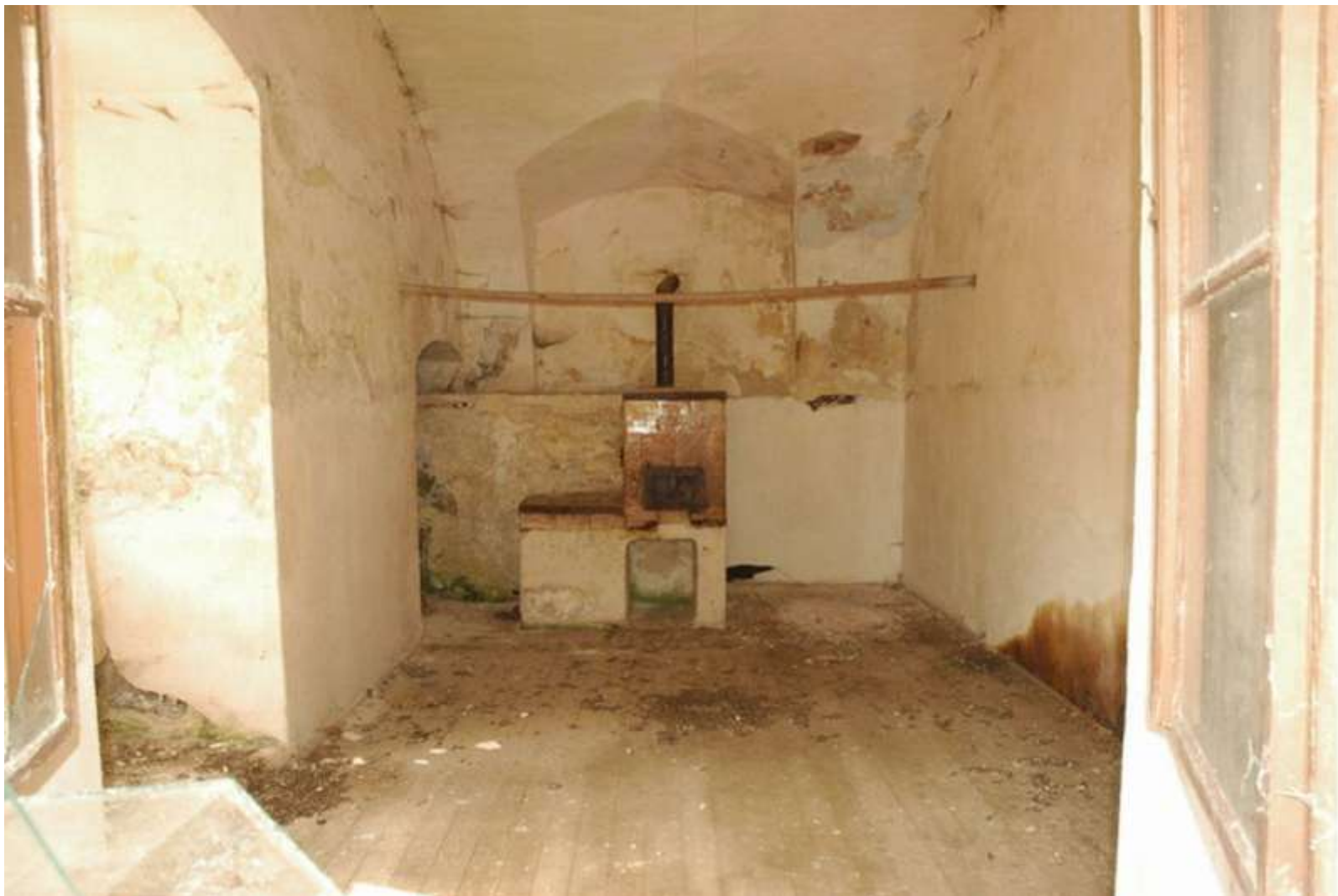
Obr. 4 Byt Panklových v roce 2007