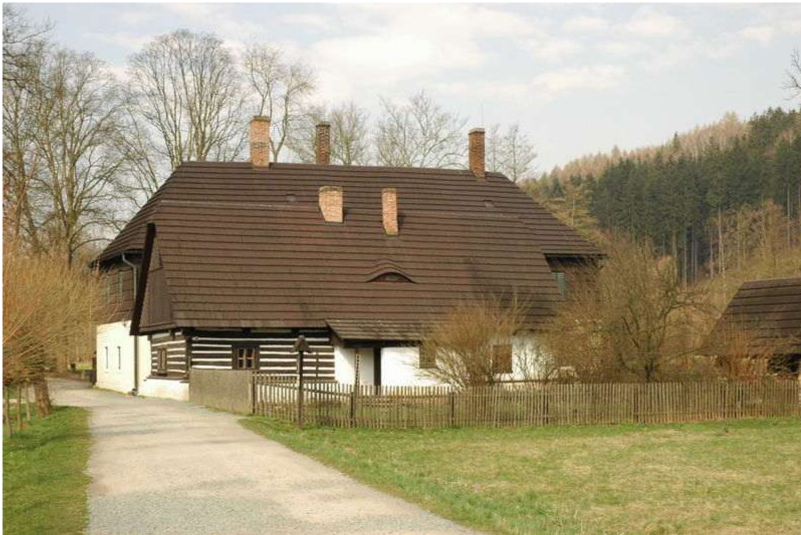
Obr. 3 Staré bělidlo